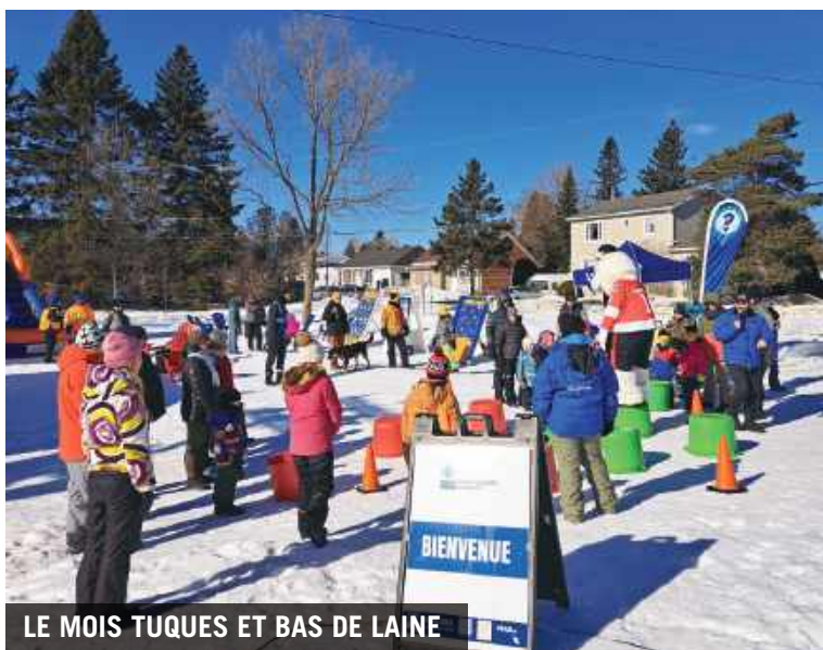
LE MOIS TUQUES ET BAS DE LAINE