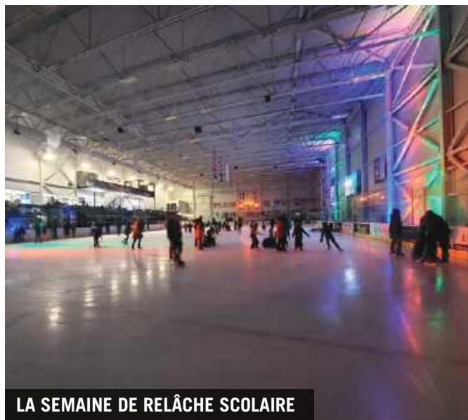
LA SEMAINE DE RELÂCHE SCOLAIRE