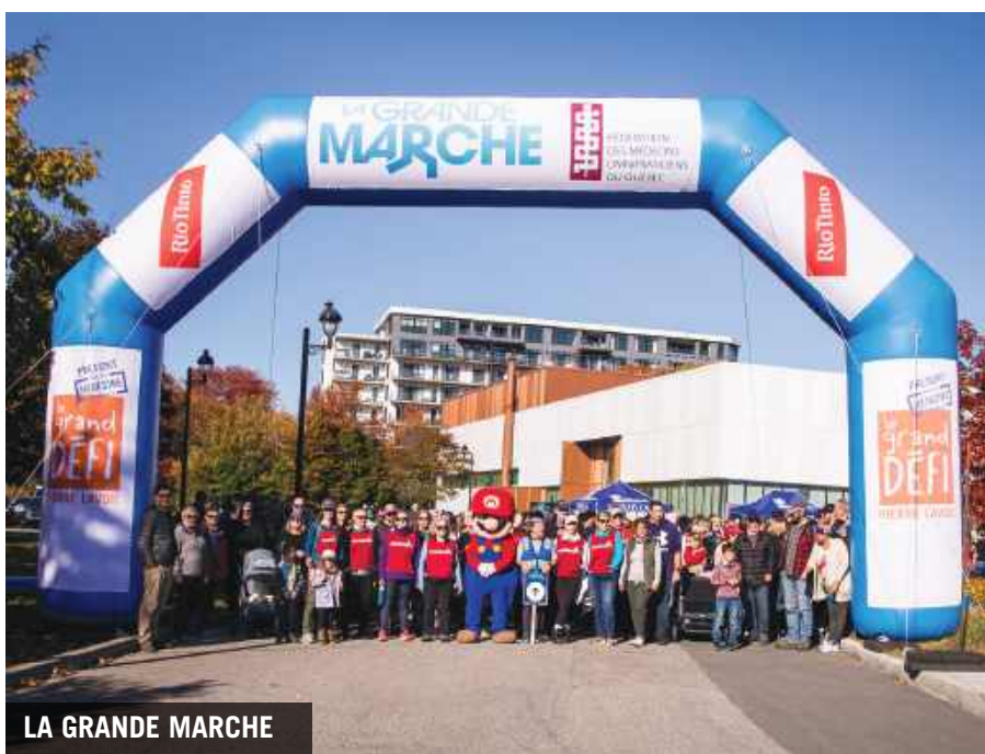
LA GRANDE MARCHÉ