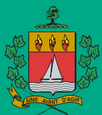
Sylvain Juneau, maire Ville de Saint-Augustin-de-Desmaures

Les prochaines séances ordinaires du conseil municipal auront lieu les mardis 4 et 18 février à 18 h 30 dans la salle du conseil à l'hôtel de ville, située au 200, route de Fossambault à Saint-Augustin-de-Desmaures.