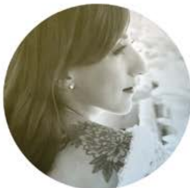
Florence K 3 février 2017