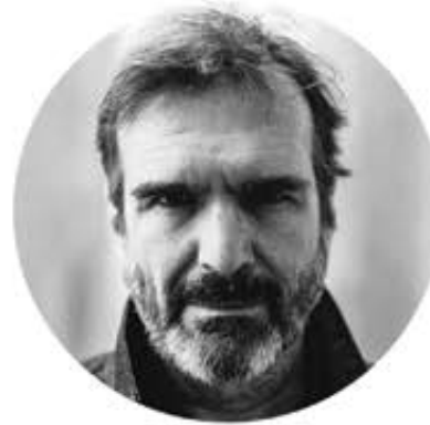
Pierre Flynn 3 décembre 2016