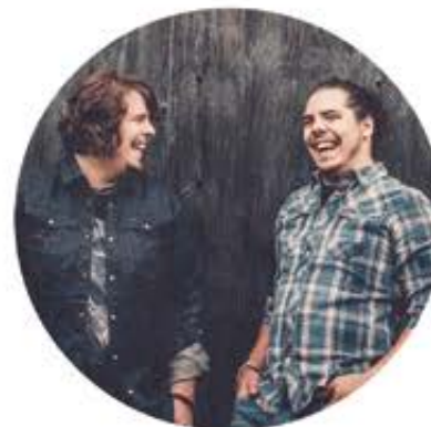
2Frères 16 février 2017