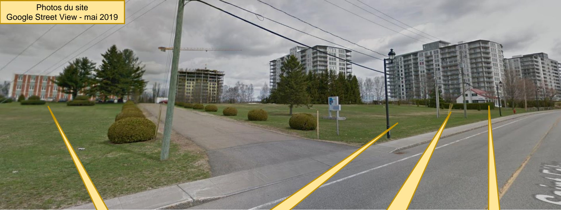
Villa des Jeunes