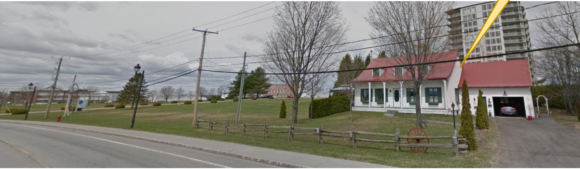
4852, rue Saint-Félix