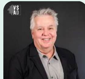
District no 7 (Haut-Saint-Laurent)