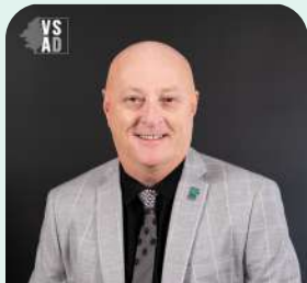
District no 5 (Lac Sud)