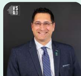
District no 3 (Lahaye)