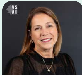
District no 6 (Les Bocages)