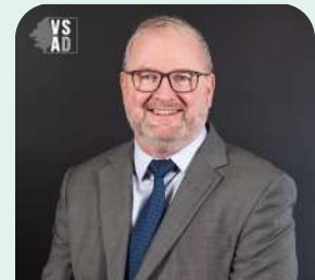
District no 8 (Lionel-Groulx)