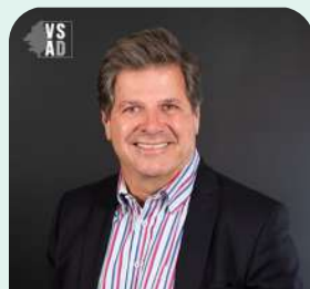
District no 2 (Portneuf)