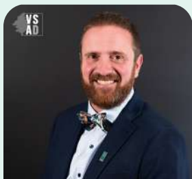
District no 1 (Des Coteaux)