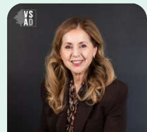
District no 4 (Du Roy-Lac Nord)